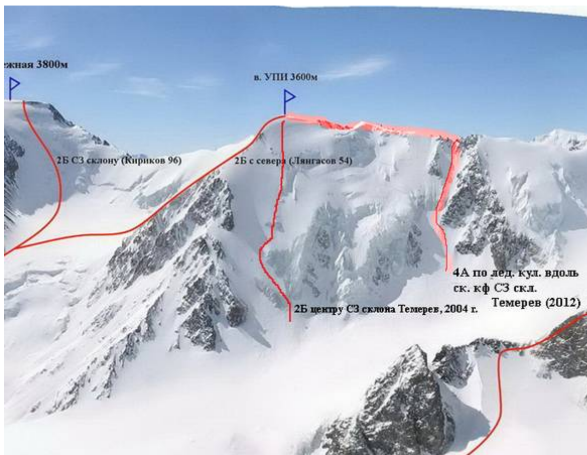
Фото общего вида вершины